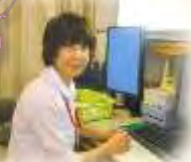
皮膚排泄ケア 認定看護師