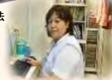
緩和ケア 認定看護師