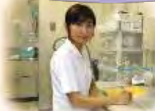
がん化学療法 認定看護師