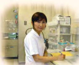
がん化学療法 認定看護師