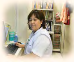
緩和ケア 認定看護師