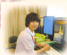
皮膚排泄ケア 認定看護師